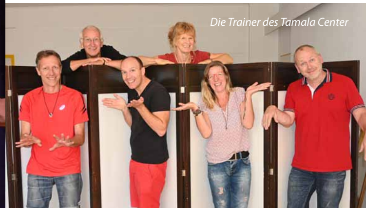
Die Trainer des Tamala Center

Wenn du dich für eine unsere Ausbildungen interessierst, sollte du zunächst an einem unserer Schnupperworkshops teilnehmen. Diese vermitteln erste praktische Erfahrungen mit der Welt des Clowns oder des Humors und dienen gleichzeitig als „Info-Seminar“. Unsere Schnupperworkshops findest du hier: www.tamala-center.de